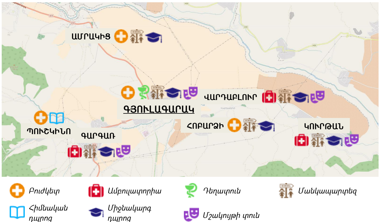
Քարտեզ 2. Գյուլագարակ համայնքի կրթական, առողջապահական ու մշակութային հաստատությունների տեղաբաշխումը

Համայնքի կրթական, առողջապահական ու մշակութային հաստատությունների տեղաբաշխումը ներկայացված է քարտեզ 2-ում: